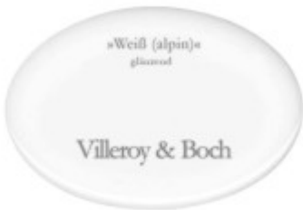
Dieses weiße Keramikbecken ohne Einbauliste - glänzend Die Abkantung ist stark vergrößert! (Originalgröße: 93 mm x 41 mm)